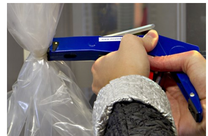
Schneideknopf drücken und gleichzeitig mit dem Handhebel den Clipbandüberstand abschneiden.