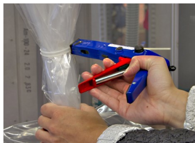
Clipbandüberstand in den Bandrapper einführen und mit dem Handhebel das Clipband fest anziehen.