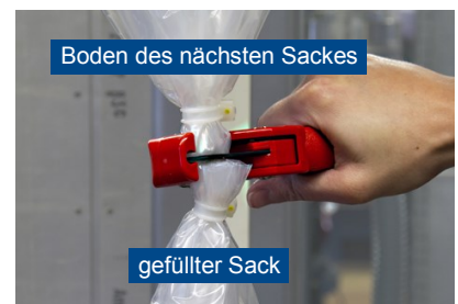
Mit der Folienschneidezange die Folie trennen.