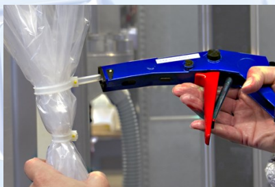
Oberes Clipband umlegen, anziehen und den Überstand abschneiden.