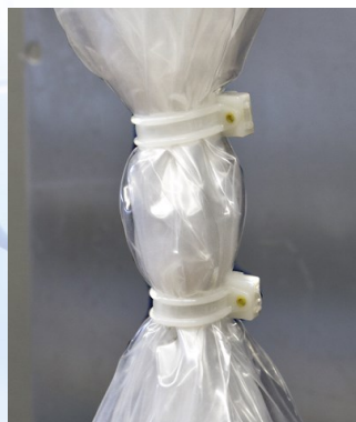
Korrekt angebrachte Verschlüsse.