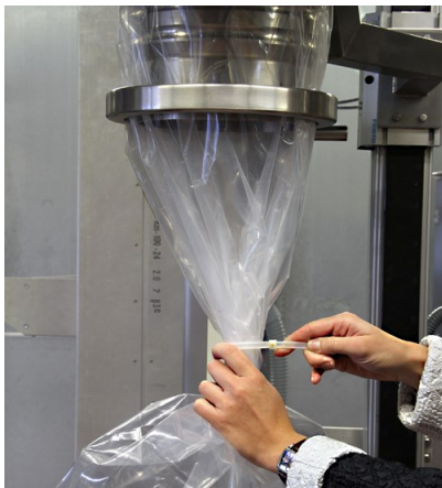
Endlossack formen, Clipband umlegen und manuell anziehen.