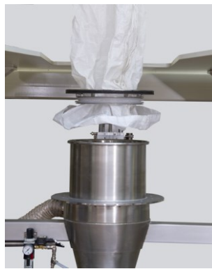
Big-Bag Auslauf durch den Dichtring ziehen.