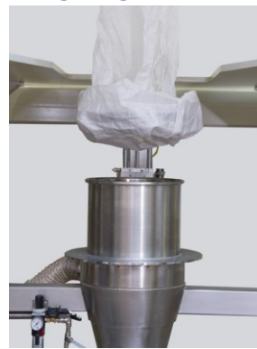
Auslaufende nach oben falten.