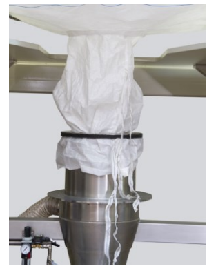
Der Ring senkt sich, die Blähdichtung dichtet das System ab.