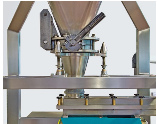
Anschluss des Produktbehälters an die Dosierrinne.